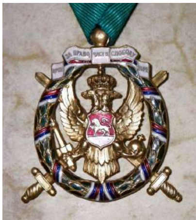
Spomenica Božićnog ustanka