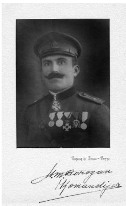
Komandir Mašan M. Borozan (1890–1972)

godine. Nakon kraha crnogorskog ustanka, Mašan M. Borozan emigrirao je u Italiju i bio u političkom egzilu i u oficirskom sastavu Komande crnogorskih trupa u Gaeti (1919–1921). Iz Italije se u Crnu Goru vratio kao poručnik crnogorske vojske jula 1919. godine u ekspediciji Krsta Zrnova Popovića sa ciljem podizanja naroda na ustanak. Komitovao je potom najčešće na prostoru Riječke i Katunske nahije i preduzimaо gerilske akcije protiv srpskih okupacionih trupa, žandarmerije i bjelaških pristalica i kontrakomitskih plaćenika. Režim ga je pozivao na predaju, a budući da je on odbio da to učini, oglasio ga je za odmetnika i hajduka. Okupacioni režim nije uspio da ga uhvati.